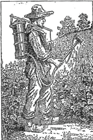
Le vigneron. La pulvérisation des vignes au XIX e siècle.

Tous les mois, régulièrement, il transporte et livre son vin chez ses clients irignois mais surtout lyonnais ou encore à Feyzin. Dans ce cas, il les amène au port d'Irigny et il traverse sans doute par le bac. Il les livre en bereille et certains de