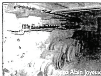
Le cellier de B. Bouillon en Presles, dans son état actuel.

1823 le cultivateur le plus imposable d'Irigny.